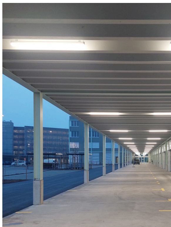
Neubau Recyclingcenter mit Ökihof im Göbli