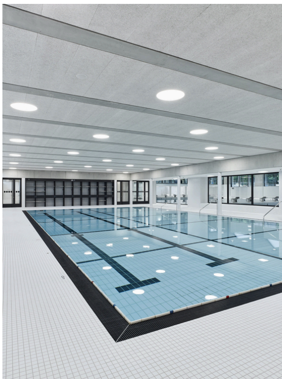
Schwimmhalle Neufeld, Bern